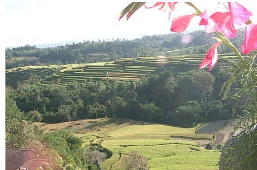
Région de Pacung